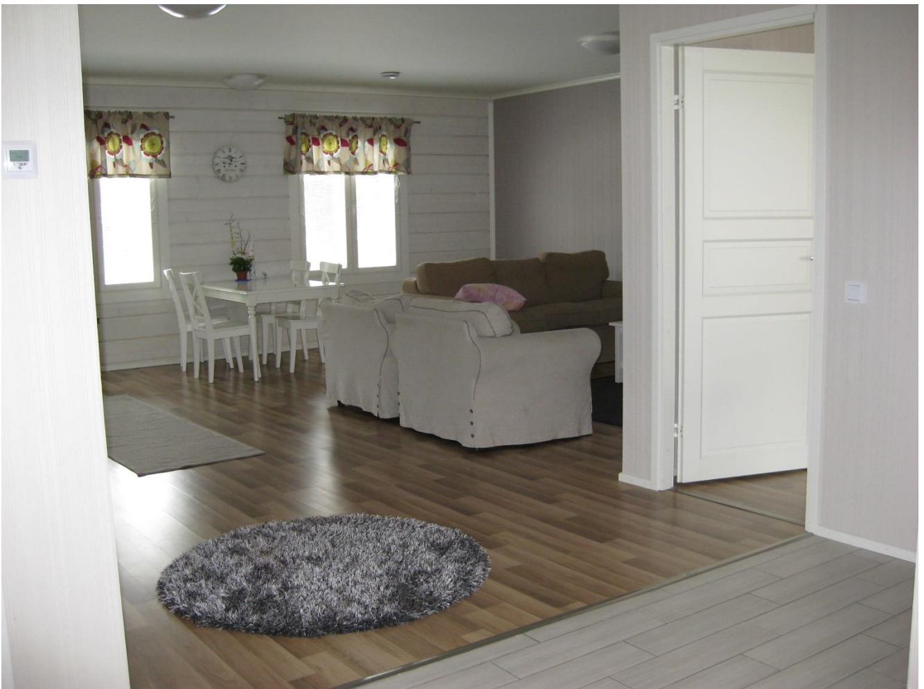
Perhekuntoutuksen asunto sisältä kuvattuna

Palvelut koostuvat perhearvioinnista ja –kuntoutuksesta. Perhekuntoutuspalvelut voidaan toteuttaa joko kotona tai Palvelukeskus Jokikallion perhekuntoutusasunnoissa. Perhekuntoutuspalveluilla tuetaan yksilöiden ja perheiden elämää arjessa. Perhe hyötyy perhekuntoutuspalveluista, kun he ovat suuren tuen tarpeessa tai tilanne on kriisiytynyt, huostaanoton purkuprosessi on menossa, akuutin huostaanoton riskissä, avohuollon sijoituksen välttämiseksi, kiireellisen sijoituksen jälkeisen kotiinpaluun turvaamisessa tai perheen tarvitessa lisätukea, kun avohuollon muut tukitoimet ovat riittämättömät.