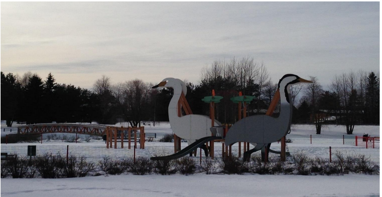
Nivalan kaupungin puistoaluetta