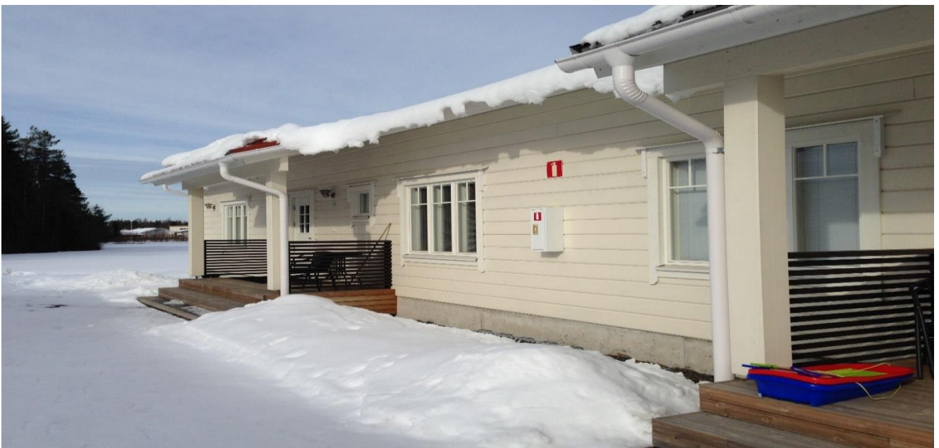
Palvelukeskus Jokikallion perhekuntoutusasunnot

Palvelukeskus Jokikallio sijaitsee Nivalan kaupungin keskustan lähellä. Jokikallion palveluntarjontaan kuuluu perhekuntoutuspalvelut sekä lisäksi avopalveluita yksilöiden ja perheiden tueksi. Jokikallio tarjoaa sijaishuoltopalveluita 0-18 vuotiaille lapsille ja nuorille, kriisivastaanotosta itsenäistyvän nuoren tukeen. Sijaishuoltopalveluiden lisäksi Jokikalliolla on kaksi itsenäistymisasuntoa.