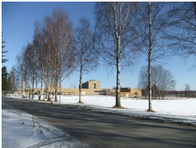
Kuva 1. Hämeenlinnan vankila.

Työpajatarvikkeet olivat vankilan puolesta ja ne olivat helposti saatavilla toimintakeskuksessa.