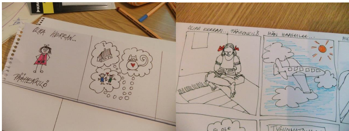
Kuva 6. Sarjakuvaa.

Tänään piirsimme aluksi omakuvallisen sarjakuvan, jossa olisi kuusi kuvaa. Tämän tehtävän sain kollegaltani. 1) Olipa kerran päähenkilö. 2) Mitä hän haaveilee/toivoo? 3) Mikä tai kuka auttaa vai auttaako kukaan? 4) Mikä esteenä? Mitä vaikeuksia? 5) Miten päähenkilö selviää esteistä? 6) Miten tarina loppuu? Millainen on tarinan loppu? (Marjukka Irni)