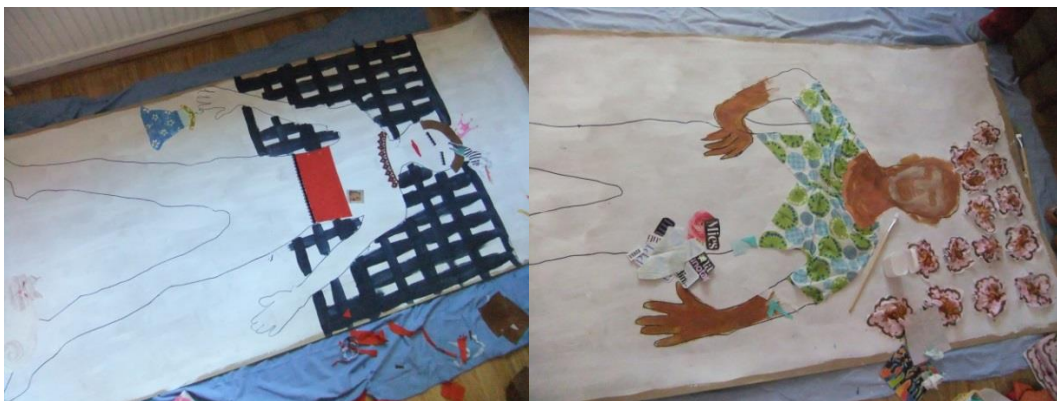
Kuva 5. Hahmojen muotoutuminen.

Minä yllätyin monta kertaa omakuvani äärellä. Kun mielijohteesta aloin seurata jotain materiaalia tai maalaamista, se tuottikin havainnon, että tämähän on totta. Materiaalien, tekstien, piirrettyjen viivojen ja siveltimenvetojen yhdistyessä alkoi muodostua kokonaisuuksia asioista elämässäni. Olin jo näkevinäni hänellä naisellisen, tyttömäisen naishahmon ja minun hahmoni oli mielestäni maskuliinisempi. Huomasin myös, että hänen kuvassaan vaikeat asiat olivat hahmon ulkopuolella ja minun kuvassani toisinpäin.