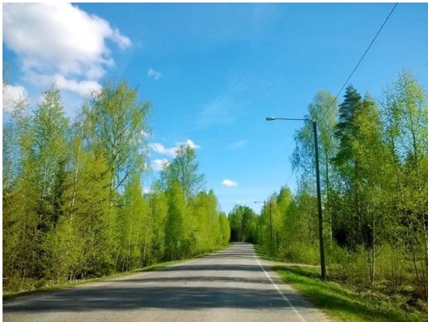
Kuva 8. Matkalla.

Satoi ja kevät tuoksui, kun läksin kotimatalle, joka varsinkin nyt tuntui menevän aivan liian nopeasti. Nyt tunsin hyvin voimakkaasti, ettei aika riitä.