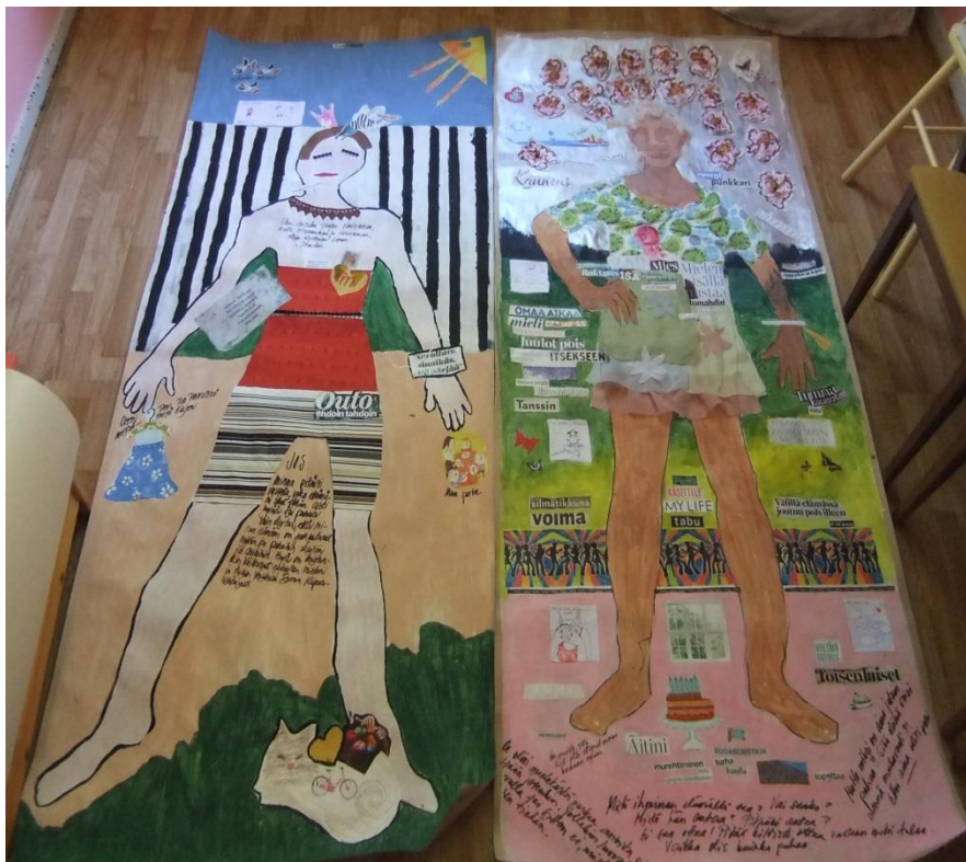
Kuva 9. Valmiit teokset.

Minä en halunnut omasta teoksestani avata yksittäisten kuvien tai tekstien merkityksiä, koska halusin jättää katsojan omalle tulkinnalle tilaa. Koin teokseni kokonaisuudeksi, josta katsoja voi itse etsiä merkityksiä.