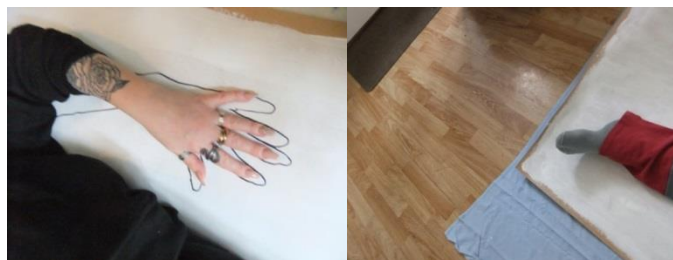
Kuva 4. Uudet ääriviivat.

Leikkasimme vahvemmassa kartongista reilusti pituuksiemme mittaiset palat ja pohjustimme ne. Sillä aikaa kun pohjustukset kuivuivat, luimme toisillemme ääneen edellisellä kerralla kirjoittamamme ”tajunnanvirran” tekstit. En kuitenkaan halunnut, että alamme niitä analysoimaan syvemmin, vaan päätin kirjoitusten antaa pyöriä ajatuksissamme ja jatkoimme kollaasin parissa työskentelyä. Piirsimme toistemme ääriviivat kartongille. Kartutimme sen jälkeen kollaasimateriaalia leikaten lehdistä kuvia ja tekstejä, jotka meitä kiinnostivat tai muuten olivat tärkeitä meille. Vartijan seurassa kävimme toisesta tilasta hakemassa tekstiili- ja muuta materiaalia teoksiamme varten.