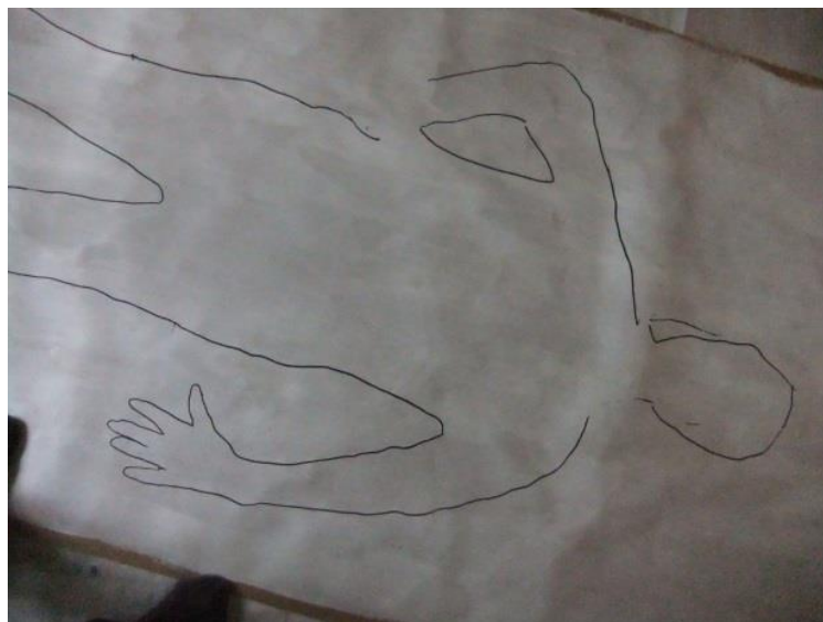
Kuva 3. Ääriviivaa.