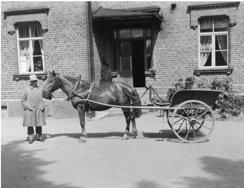
Kuva 5. Rurik Pihkalan hevoskyyti odottaa Huttulan edessä

Näyttelyn seuraavissa kuvissa on valjakko. Viidennessä kuvassa on Rurik Pihkalan hevoskyyti Huttulan edessä (kuva 5.) ja kuudennessa kuvassa on johtajan ajokki (kuva 6.). Johtajan ajokista huomaa, että se on korkea-arvoisen henkilön kyyti parivaljakosta nelipyöräkieseillä. Hevoskyyti on huomattavasti arkisempi. Kuvien taustalla näkyy Huttula ja Vanha Konttori.