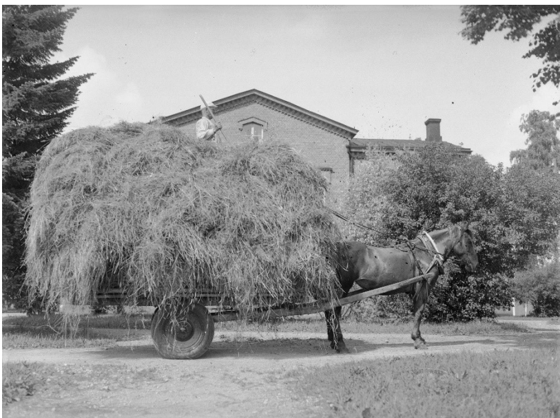
Kuva 7. Heinää korjaamassa keinupyöräkärriillä 1939

Viides ja kuudes kuva ovat kuvia valjakoista, eli seuraavissa kuvissa hevosilla tehdään töitä. Hevosilla tehtävät työt ovat olleet historiassa ympärivuotisia. Seitsemännessä kuvassa korjataan heinää keinupyöräkärriillä vuonna 1939 (kuva7.) ja kahdeksannessa kuvassa pehtoori on äestämässä hevosilla (kuva 8.).