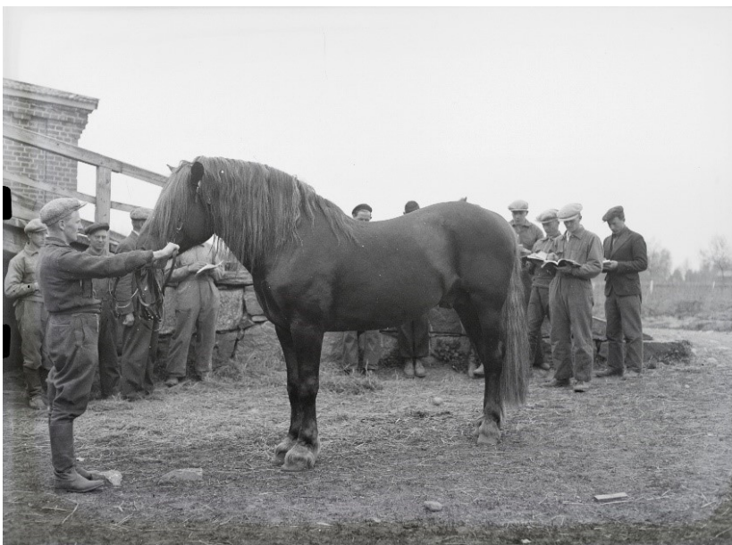
Kuva 9. Kahju opiskelijoiden ympäröimänä 1939

Yhdeksännessä kuvassa opiskelijat arvioivat Kahjua vuonna 1939 (kuva 9.). Oriin asennosta ja opiskelijoiden sijainnista päätellen kyseessä on rakenteen arvioiminen.