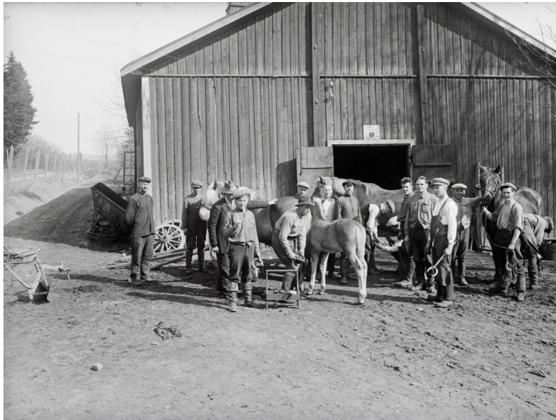
Kuva 10. Kengityskurssi

Näyttelyn kaksi viimeistä kuvaa liittyvät opiskeluun ja hevosten kanssa puuhasteluun.