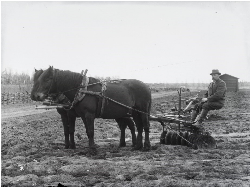
Kuva 8. Pehtoori äestämässä hevosilla

Yhdeksännessä kuvassa opiskelijat arvioivat Kahjua vuonna 1939 (kuva 9.). Oriin asennosta ja opiskelijoiden sijainnista päätellen kyseessä on rakenteen arvioiminen.