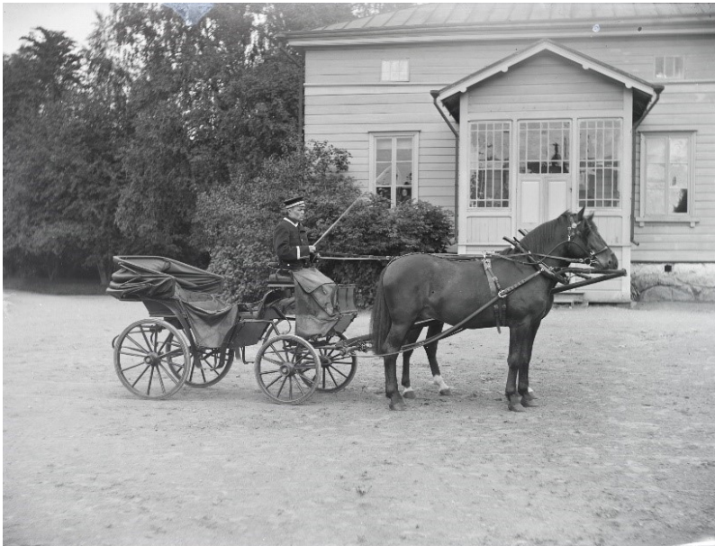
Kuva 6. Johtajan ajokki

Viides ja kuudes kuva ovat kuvia valjakoista, eli seuraavissa kuvissa hevosilla tehdään töitä. Hevosilla tehtävät työt ovat olleet historiassa ympärivuotisia. Seitsemännessä kuvassa korjataan heinää keinupyöräkärriillä vuonna 1939 (kuva7.) ja kahdeksannessa kuvassa pehtoori on äestämässä hevosilla (kuva 8.).