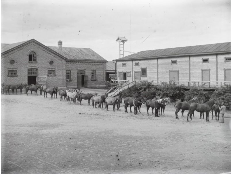
Kuva 4. Mustialan Emätilan hevosia viedään laitumelle 1900-luvun alussa

Näyttelyn seuraavissa kuvissa on valjakko. Viidennessä kuvassa on Rurik Pihkalan hevoskyyti Huttulan edessä (kuva 5.) ja kuudennessa kuvassa on johtajan ajokki (kuva 6.). Johtajan ajokista huomaa, että se on korkea-arvoisen henkilön kyyti parivaljakosta nelipyöräkieseillä. Hevoskyyti on huomattavasti arkisempi. Kuvien taustalla näkyy Huttula ja Vanha Konttori.