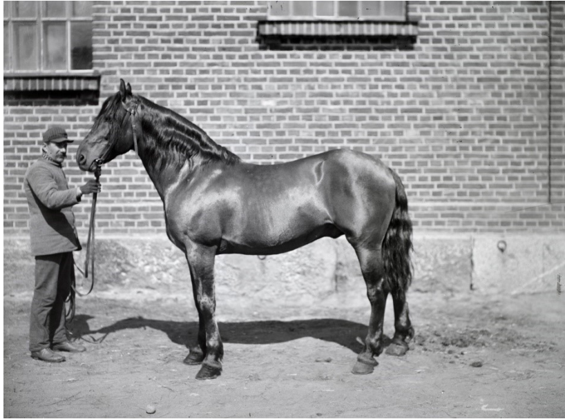
Kuva 3. Ori Olof Mustialassa 1880-1890 –luvuilla