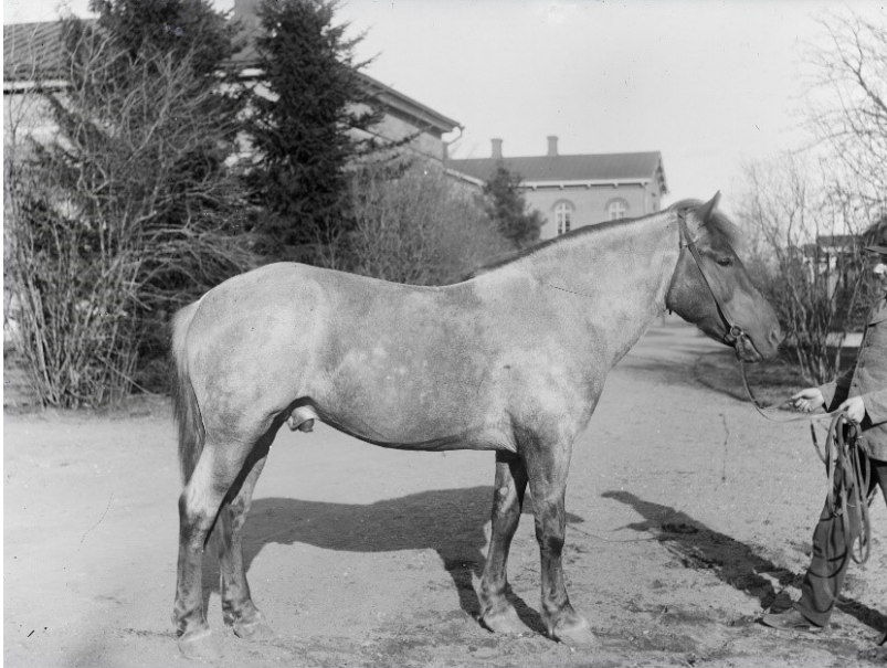
Kuva 1. Mirkku III 474

Toisessa kuvassa on myös Mustialassa siitosoriina toiminut Kahju (kuva 2.) Kahju syntyi 1930 Harjun koulutilalla Virolahdella ja siirtyi Mustialan Emätilan omistukseen vuonna 1935. Kahjusta kerrottiin, että se oli oikein hyvä työ- ja siitoshevonen sekä erityisen hyvä vetäjä. Kahju sai myös useita palkintoja. (Sukuposti. n.d.a.) Kahju oli tyypiltään hyvänlainen ja sillä oli vankka, syvä ja leveä runko. Kahjua käytettiin siitoksessa vuosina 1935-1945 ja se astui 237 tammaa, joista jäi ainakin 84 varsaa. (Laine 2013)