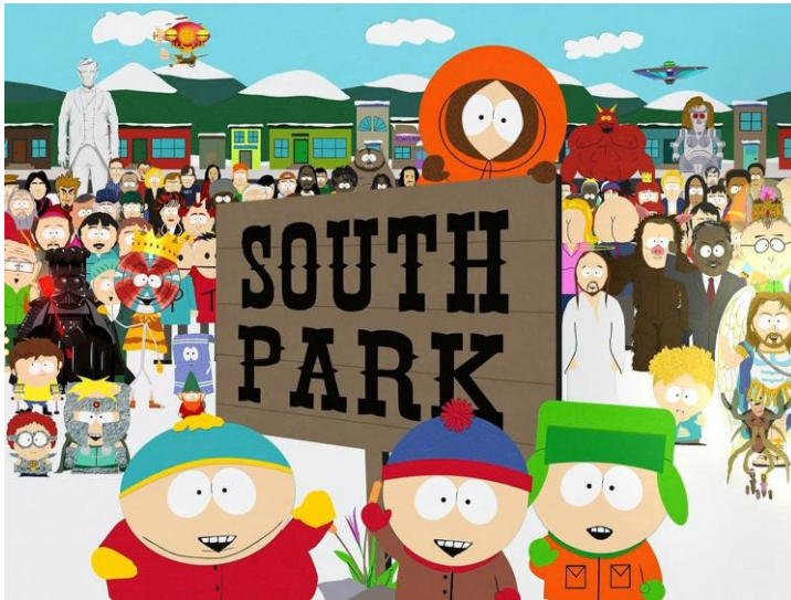
KUVA 2. South Parkin vakiohahmoja, kuva sarjasta South Park.

South Park on ollut jo 20 vuotta yksi tunnetuimmista mustan huumorin edustajista. Sarja kertoo South Parkin kylästä, jossa päähenkilöinä seikkailevat neljä 8-vuotiasta poikaa. Kylä on täynnä outoja ihmisiä sekä outoja tapahtumia. Sarjassa on käsitelty armatomasti ideologioita ja rikottu tabuja, jotka liittyvät esimerkiksi aborttiin, uskontoihin, politiikkaan, homoseksuaalisuuteen, transseksuaalisuuteen, murhaamiseen jne.