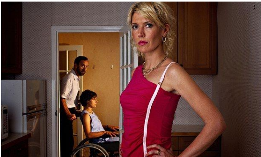
KUVA 3. Kuva Nighty Night-sarjan ensimmäisestä kaudesta.

Nighty Night on brittiläinen, musta komedia vuosilta 2004-2005. Sarjassa keskitytään vain yhteen päähenkilöön, jonka synkkä persoonallisuus tekee sarjasta monella tavalla mustimpia mitä olen nähnyt.