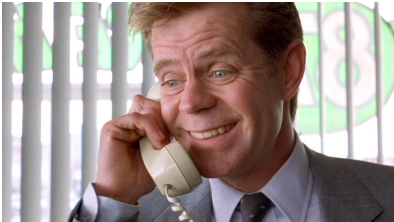
KUVA 7. Jerry Lundegaard (William H. Macy) Fargo-elokuvassa.

Jerry Lundegaard on Fargo-elokuvan päähenkilö, mies, joka ajautuu epätoivoiseen tekkoon. Hän on rahapulassa, eikä hänen rikas anoppinsa suostu antamaan hänelle lainaa. Jerry palkkaa kaksi rikollista kidnappaamaan vaimonsa, jotta saisi anoppinsa maksamaan kovat lunnaat. Kaikki väistämättä kuitenkin alkaa menemään pieleen, ja Jerry menettää otteensa operaatiosta.