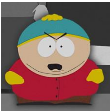
KUVA 9. Eric Cartman ”South Park”-sarjasta.