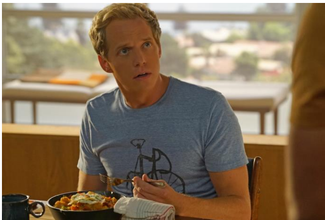
KUVA 8. Jimmy Shive-Overly (Chris Geere) You’re The Worst”-sarjasta.

Jimmy on toinen amerikkalaisen ”You’re The Worst” -komediasarjan päähenkilöistä. Sarja kertoo kahdesta kaikin puolin myrkyllisestä persoonallisuudesta, Gretchenistä ja Jimmystä, jotka eivät ole kovin menestyneitä ihmissuhteiden maailmassa, ja päätyvät suhteeseen toistensa kanssa. Sarja on monella tavalla kenties likainen kääntöpuoli nor-