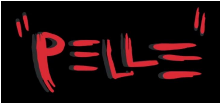
KUVA 4. ”Pelle”-elokuvan otsikko, kuva lyhytelokuvasta ”Pelle”.

Seuraavaksi käsittelen käsikirjoittamani ”Pelle”-lyhytelokuvan käsikirjoitusta. Synopsis ja käsikirjoitus ovat liitteinä (Liite 1 ja 2).