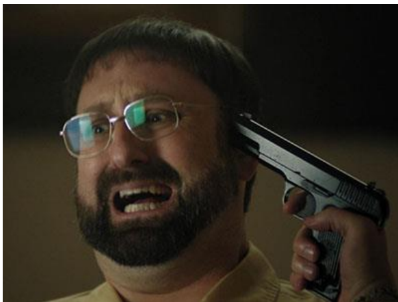
KUVA 1. Gary Royce (Eric Warheim) sarjasta Tim & Eric’s Bedtime Stories, jakso 8.

Mustaan ja absurdiin huumorin erikoistuneet Tim Heidecker ja Eric Warheim (Tunnettuja sketsisarjasta Tim & Eric’s Awesome Show. Great Job. (2007-)) tekivät vuonna 2014 synkkääkin synkemmän komediasarjan Tim & Eric’s Bedtime stories , jossa jokainen jakso kertoo oman tarinansa, lähes poikkeuksetta tuhoon ajautuvasta päähenkilöstä. 6.11.2015 esitettiin jakso ”Sauce Boy”, on mielenkiintoinen sekoitus positiivisuutta ja fatalismia. Päähenkilö, Gary Royce, on addiktoitunut vaippojen syömiseen. Hämärä