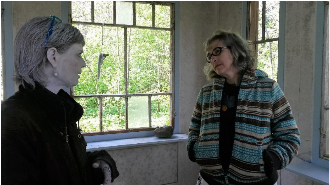
Kuva 1. Iloinen jälleennäkeminen surutalossa.

jaksamisessa. Kuinka onnekas olen, että olen saanut tutustua ja työskennellä molempien taiteilijoiden kanssa!”