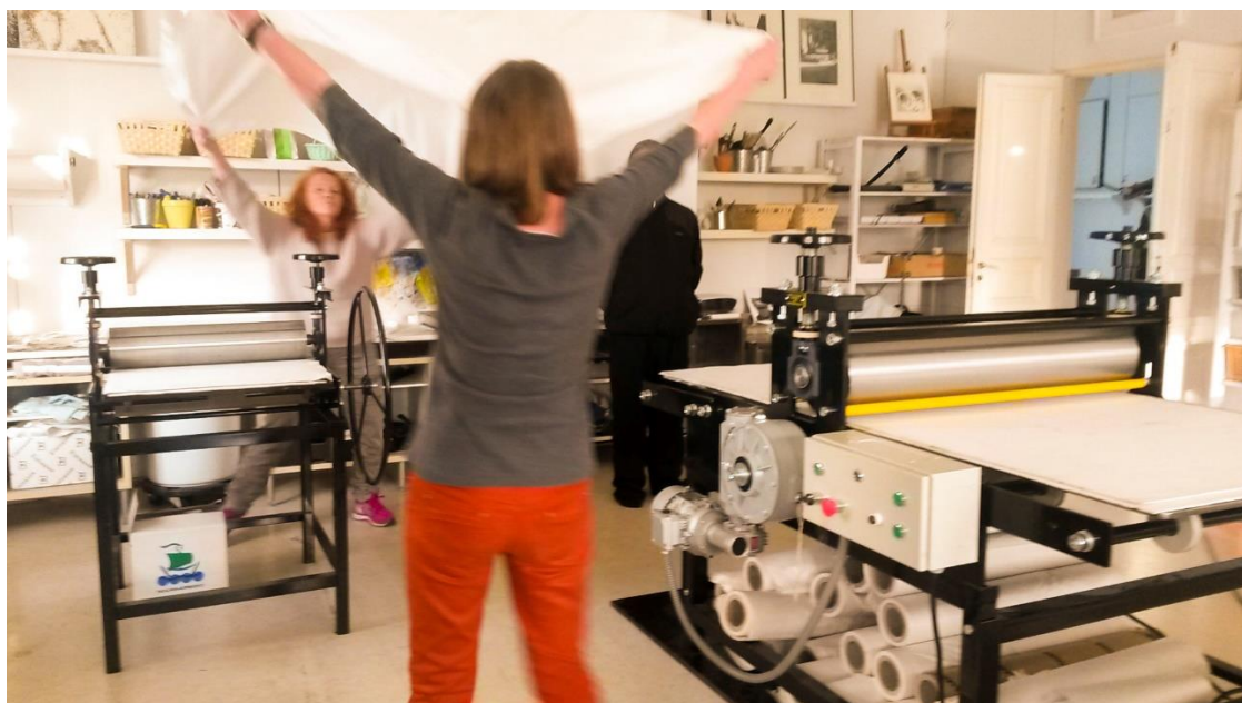
Kuva 2. Prässipormanssi.