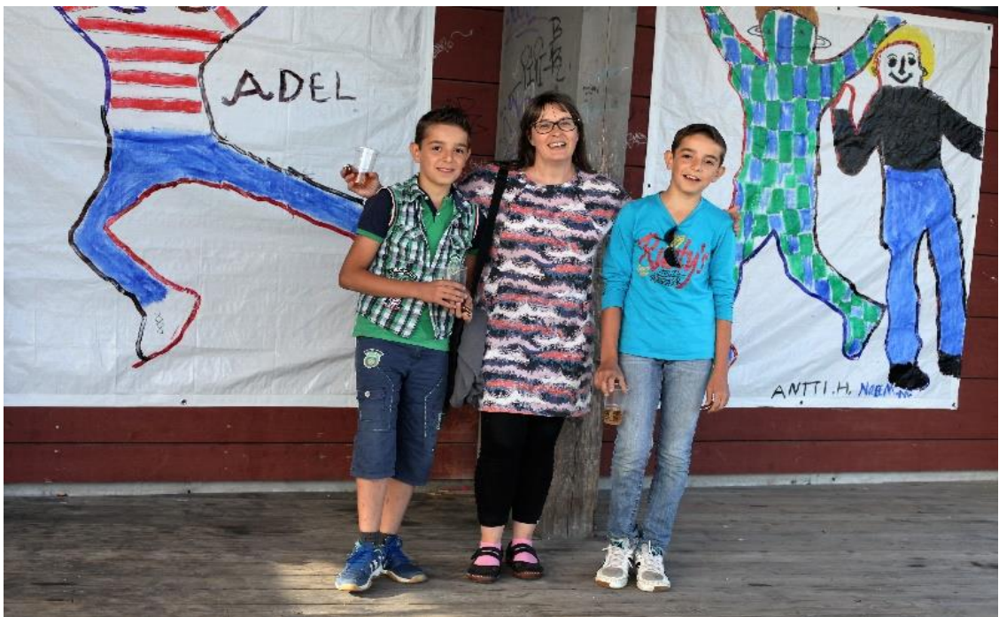
Kuva 3. Hymyilevät syyrialaispojat.

enemmän, vaikka workshop on ilmainen ja järjestän sen opiskelu- ja näyttelykiireiden keskellä. Olen jännittänyt workshopin ohjaamista jo viikon, miettinyt miten lasten yhteistyö alkaa sujua ja miten kulttuurierot vaikuttavat. Kaikki sujuu kuitenkin hyvin kieliongelmista huolimatta. Syyrialaispojat tekevät molemmat kuvan kauniista isosilmäisestä naisesta. Luulin, että islam kieltää ihmisen kuvaamisen. Kysyn heiltä ketä kuva esittää, onko se äiti? Pojat ovat hiljaa, he eivät vastaa. Käymme taiteen tekemisen välissä ulkoilemassa, pojat haluavat pitää minua kädestä. Myöhemmin kunnan pakolaiskoordinaattori laittaa minulle sähköpostin, jossa kiittää workshopin järjestämisestä. Hän kertoo, että pojat olivat viihtyneet todella hyvin. Heillä on ollut hankalaa, ovat viettäneet kolme vuotta pakolaisleirillä huonoissa olosuhteissa ennen Suomeen tuloa ja heidän äitinsä oli kuollut. Seuraavina viikkoina en voi olla ajattelematta hymyilevien syyrialaispoikien surua. Alakuloa ei voi välttää. Kiroan paha maailmaa ja itseäni, kun en voi olla enemmän.