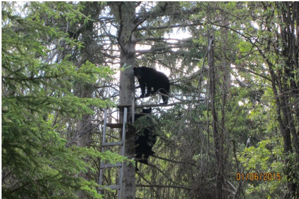
Kuva 10. Syöteillä tapasi usein paljon karhuja. Nämä kolme yksilöä pakenivat kytäys- puuhun mönkijän ääniä.

Minusta oli hienoa miten Kanadassa suhtauduttiin siihen, että mustakarhut liikkuivat paljon kaupungin läheisyydessä. Suomalainen tapa käsitellä suur- petoja, jos ne tulevat näyttävän karvaisen naamansa lähelläkään ihmisasu- tusta, on suorastaan hysteerinen välillä. Kun siihen lisää vielä uteliaat ihmi- set, jotka tunkevat katsomaan karhua, vaikka asiasta on kielletty, on soppa valmis. Kyseenalaistan kokemuksieni perusteella vahvasti sitä, että tarvit- seeko median edes aloittaa hurjaa tiedottamista, että karhu on nähty taa- jama-alueen läheisyydessä. Karhut kuuluvat kyllä metsiin, mutta ilmainen ruoka on kenestä tahansa, niin ihmisestä kuin karhusta, äärimmäisen hou- kuttelevaa. Ihmisten pelonsekainen suhtautumisen sijaan olisi hyvä ottaa kerrankin mallia suuresta maailmasta ja oppia suhtautumaan karhuunkin kuin se olisi luonnollinen asia ilman sitä, että metsästäjiä vaaditaan samalla kertaa lopettamaan väärälle polulle vahingossa astunut nalle. On selvää, että kun ihmiset rakentavat uusia asuinalueita ennen rakentamattomille ja jopa koskemattomille alueille, niin suurpetoja tullaan näkemään ihmisten lähei- syydessä enemmän ja siihen pitää osata suhtautua rauhallisesti, ei niin kuin nykyään on ollut tapana. Tietenkään ei koskaan pidä olla tyhmänrohkea, mutta turha asian esittely mediassa ei ole hyvä asia (Kuva 10).