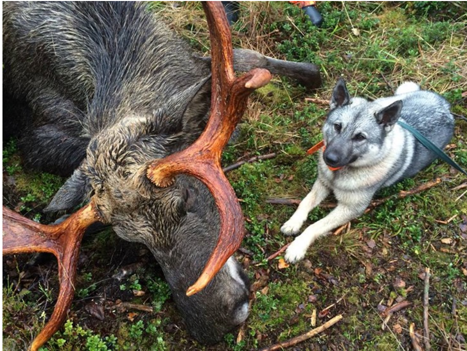
Kuva 1. Metsästyskoira on arvokas investointi, jolle yleensä hankitaan myös kalliit vaikutukset. Suomalaisessa metsästyskulttuurissa metsästyskoira on lähes välttämätön toveri.

käy, että metsästys harrastukseen käytettävä aika on 2 245-2 986 henkilötyövuotta vuodessa. Vuonna 2014 riistasta saadun lihan arvo vastasi noin 62 miljoonaa euroa. (Partanen 2016, 8.)