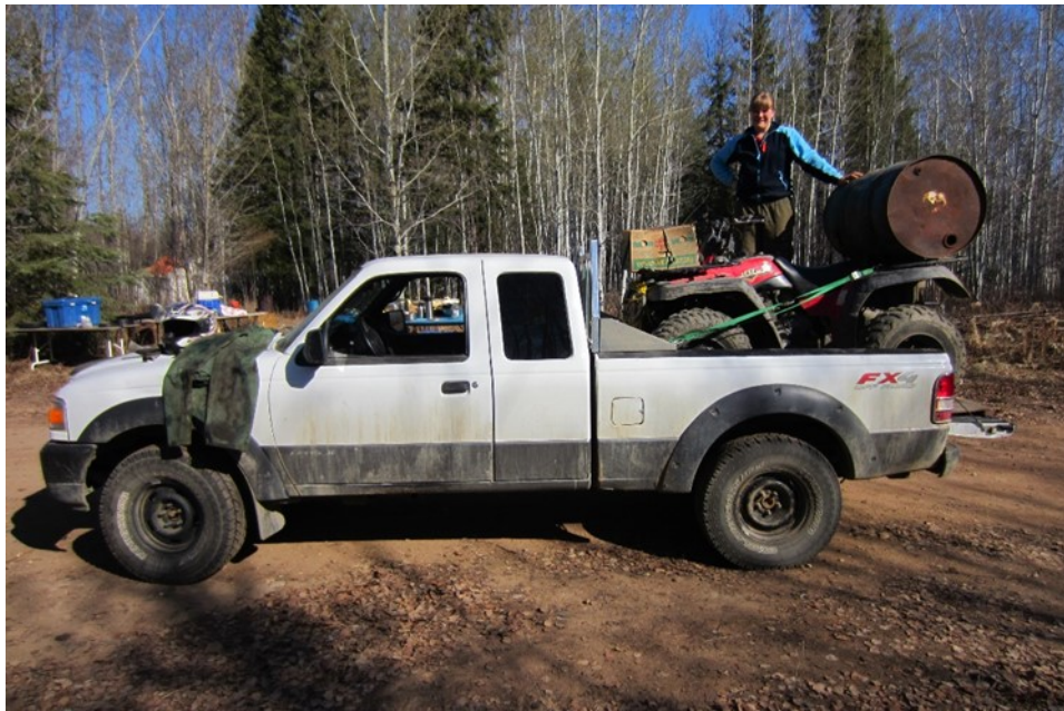
Kuva 9. Perusvarustus, kun lähdimme viemään 130 km päähän kahdeksan karhusyöttöä. (Kuva: Korvenranta 2015.)

Toinen asia, joka erityisesti kiinnitti huomiota heti ensimmäisinä päivinä High Levillä ja muutenkin ajomatkan aikana, oli se, että riistaa näkyi paljon ja kaikenlaista, tosin kuljimme autolla ja mönkijällä lähes päivittäin 200–300 km. Syy, miksi liikuimme pitkiä matkoja autolla päivittäin, oli se, että Silver Fox outfittersillä oli neljä eri syöttölinjaa. Syöttölinjalla tarkoitetaan linjastoa, joista lähin piste sijaitsi leiristä 20 km päässä ja kaukaisin 130 km päässä. Vertailun vuoksi mainitsen, että kaukaisimmalle syöttö pisteelle oli aikalailla sama matka kuin olisi ajanut Suomessa Helsingistä Vierumäelle. Kyseenalaistan vahvasti, että kuinka moni suomalainen lopulta ajaisi Suomessa samanlaisen matkan päivittäin vain viedäkseen rasvaisen kauraämpärin karhulle syötäväksi unohtamatta sitä, että mönkijällä ajetaan yleensä 20 km syöttölinjoilla, jotta kaikissa syöttöpisteissä oli muonaa karhuille (Kuva 9). Syöttölinjat koostuivat noin 10 syöttö paikasta, jonne oppaat ja minä veimme karhulle ruokaa, joka tosiaan koostui lihasta, kaurasta tai rasvasta. Pitkillä matkoilla näki paljon eläimiä, kuten mustakarhuja. Mustakarhuja tosin näkyi eniten syöttölinjoilla ja parhaimpina päivinä saattoi nähdä 10 eri karhua, joten karhujen määrä oli käsittämätön. Sudenkaan jälkien näkeminen Kanadassa ei ollut tavatonta ja erilaisia peuroja näkyi tiellä vähän väliä.