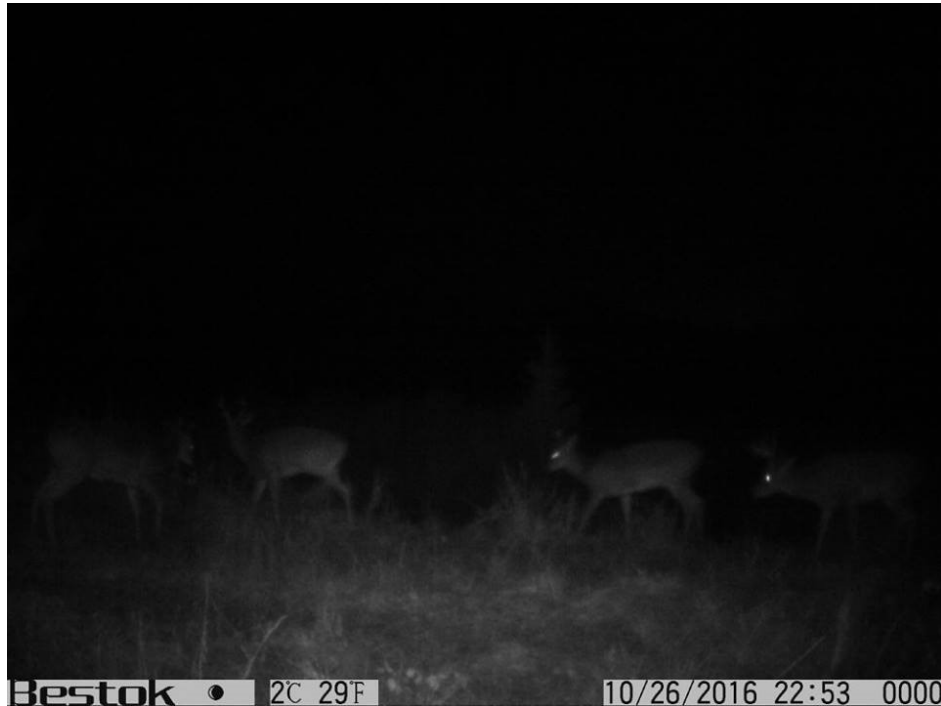
Kuva 2. Riistapello vetää puoleensa valkohäntäpeuroja.

Riistapelot ovat viime vuosina nousseet entistä suosituimmiksi, kun niiden hyödyt on huomattu metsästäjien keskuudessa ja EU-tasolla. Riistapelot parantavat luonnon monimuotoisuutta ja tarjoavat luonnonvaraisille eläimille ravintoa, lisääntymis- ja suojapaikkoja. Samalla ne vetävät ei toivotut vieraat pois tieliikenteestä, metsistä ja erikoiskasviviljelmiltä (Kuva 2). Riistapellon ei tarvitse olla suuri vaan muutama aari riittää. Jos riistapello on suurempi kuin 2 ha on todennäköistä, että riistalle tarkoitettua ravintoa menee hukkaan. (ELY-Keskus 2014.)