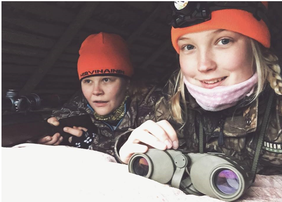
Kuva 7. Metsästyks on myös naisten harrastus ja tapa viettää rentouttava yhteinen ilta hirviä kytäten ja maailmaa parantaen.

Haastattelussa kysyin, onko metsästyks Suomessa tarpeellista. Tulokseksi tuli, nojaten haastatteluihin, että metsästyks Suomessa on tarpeellista. Ensimmäkin metsästyks Suomessa on ikiaikainen perinne, joka on lähtöisin ajoilta, kun ensimmäiset ihmiset tulivat Suomen niemelle. Metsästyks on vain saanut uusia merkityksiä ajan myötä (Kuva 7). Aluksi metsästyks oli välttämätöntä selviämisen kannalta, mutta myöhemmin mukaan tuli turkiskauppa ja siitä on hiljalleen kehitytty moderniin riistatalouteen. Modernissa riistataloudessa ei ole päämääränä se, että saadaan vain lihaa tai rahaa vaan mukana kulkevat eettiset, moraaliset, rahattomat ja luonnonsuojelulliset arvot. Nykyajan metsästäjä ei ole vain metsästäjä, joka tuo lihan pöytään henkensä pitimiksi. Hän on yksi yhteiskunnallinen keulakuva, joka luo mielleyhtymän metsästyksestä ja sitä kautta suomalaisesta riistataloudesta.