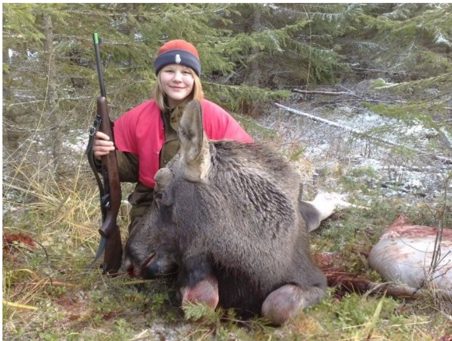
Kuva 8. Joskus pelkkä saaliskuva on metsästäjälle se kaikista arvokkain trofee, jonka muisto säilyy vuosienkin päähän.

Myös pienpetojen pyynti luetaan riistanhoitotyöksi, mutta en laske sitä tähän mukaan, koska jos metsästys loppuisi, niin automaattisesti pienpetojen ja myös vieraslajien kurissa pitäminen loppuisi. Jos metsästäjä näkee vaivan ja käyttää omaa vapaa-aikaansa siihen, että eläinlajit voivat hyvin, on vain oikeutettua, että hän saa jotain hyvää itselleen. Muunkin mielihyvän kuin sen, että riista voi paremmin ja elää onnellisemmin. Vertailu kohteena voidaan ottaa esille se, että ei siivoojakaan siivoa toisten ihmisten käyttämiä tiloja vain antaakseen toisille hyvää mieltä. Hän saa siitä itselleen hyvää rahan muodossa, joka taas metsästäjälle on joko liha tai trofee (Kuva 8).