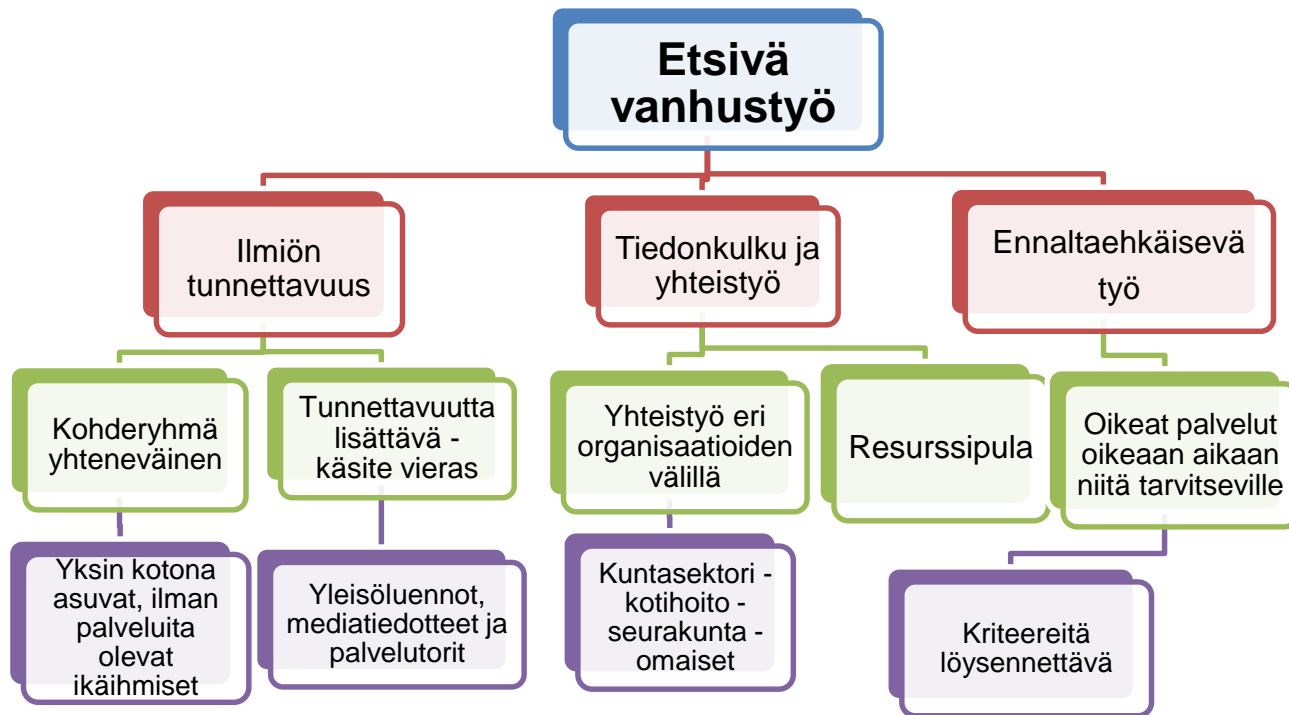
Kuvio 3. Opinnäytetyön johtopäätökset

Kuvioon kolme tiivistin opinnäytetyöni keskeisimmät johtopäätökset. Punaisessa lokerossa ovat tärkeimmät johtopäätökset eli ilmiön tunnettavuus, tiedonkulun ja yhteistyön kehittäminen sekä etsivän vanhustyön ennaltaehkäisy. Vihreällä alueella on kuhunkin johtopäätökseen johtaneet haastatteluissa esiin nousseet alueet. Violetille alueella on tutkimusaineistosta nousseet konkreettiset kehittämiskohteet. Kappaleessa 7.1 tarkastelen kolmiportaista luokittelua tarkemmin.