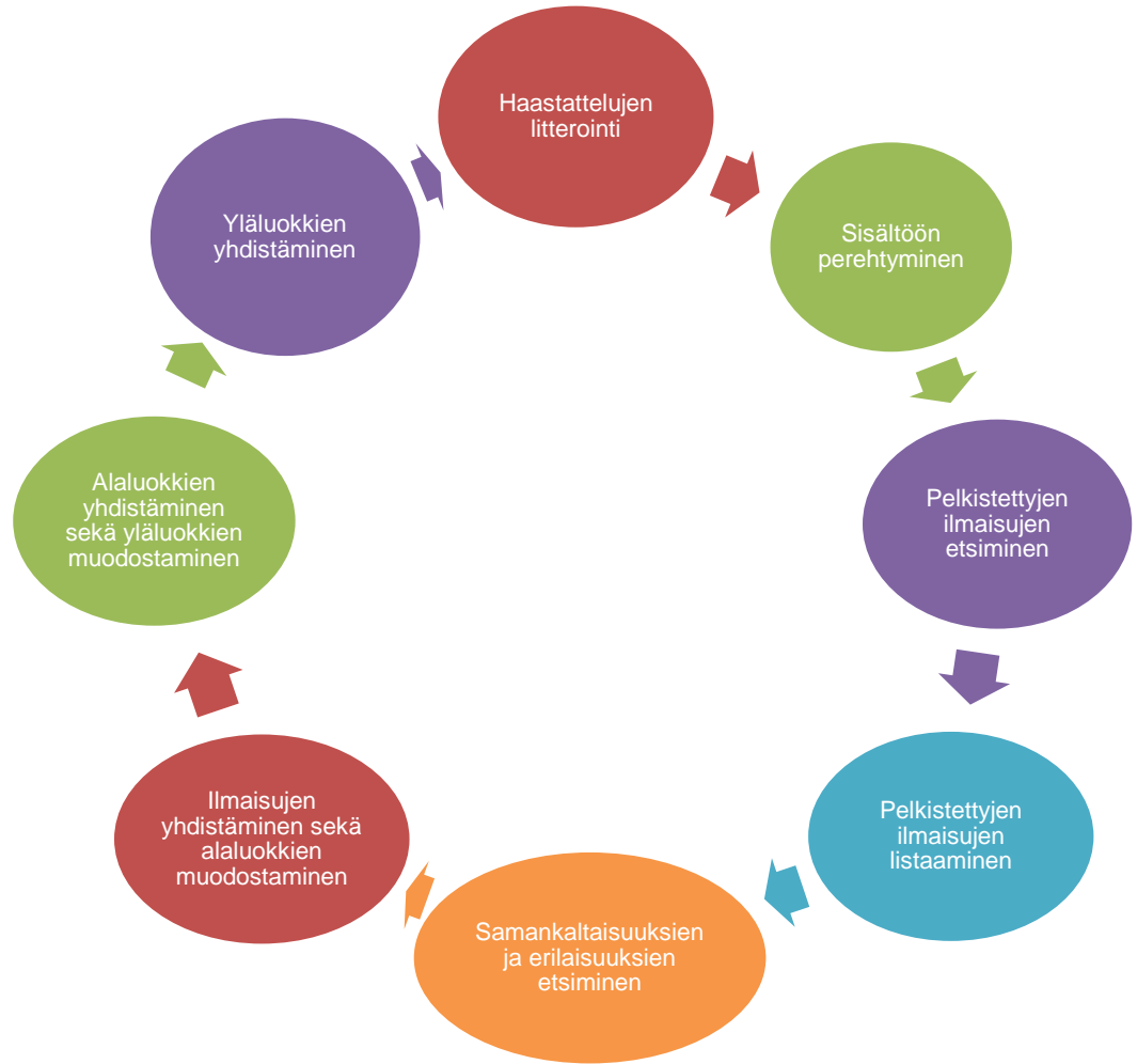
Kuvio 2. Aineistolähtöisen sisällönanalyysin vaiheet (Tuomi & Sarajärvi 2004, 111).