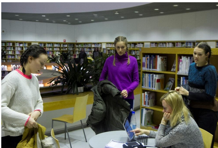
Kuva 2: Kuva teoksesta. Visa Timonen 2016.

Kävely kehittyi siihen, että tanssijat suorittavat yhteisestä päätöksestä toimintoja: riisuvat takit, keräävät kirjoja hyllyistä ja jakavat niitä katsojille sekä riisuvat kenkensä.