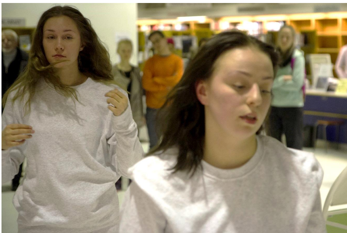
Kuva 5: Kuva teoksesta. Visa Timonen 2016.

Kuvaus kohtauksesta: Tanssijat auttavat toisiaan puhdistamaan kasvoiltaan huulipunaa ja sanomalehden jättämät mustetahrat, avaavat hiuksensa räjähtäneiltä leteiltä ja laittavat päälleen kotiasua muistuttavat lämpimät vaatteet. He ottavat sanomalehdet mukaansa ja siirtyvät tilassa kohti tietokirjallisuusosastoa ja jäävät lattialle istumaan.