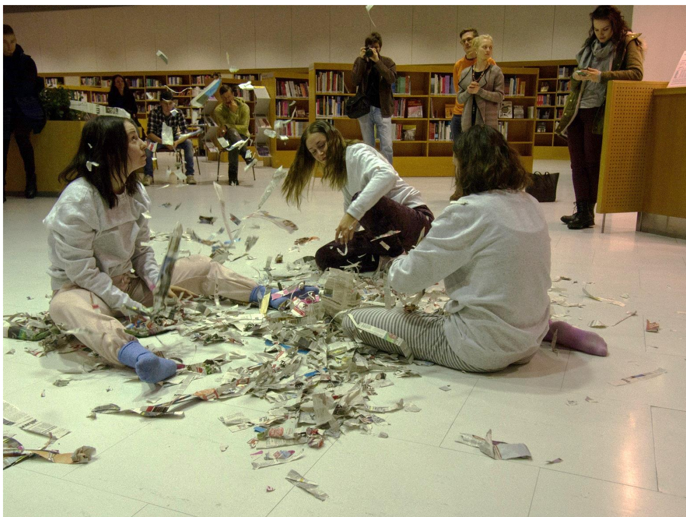
Kuva 6: Kuva teoksesta. Fox Marttinen 2016.

Keskustelimme eri tavoista rikkoa kirjaston painostava hiljaisuus. Pohdimme eri tunteiden purkauksia, itkua ja naurua, toimintoja kuten juoksemista ja riehumista, mutta mielenkiintoisin ajatuksemme hiljaisuuden rikkomisesta oli mielestäni tämä paperin repiminen paperille pyhitetyssä tilassa. Pelkäs-tään se, että ottaa paperista kiinni ja rauhallisesti repii sen, luo jo omanlaisen kontrastin tilaan. Tämä ääni kirjastossa luo omanlaisensa paradoksin suhteessa instituution toimintaan. Eräs kirjastonhoitaja sanoi paperia repiessään kanssamme jokseenkin näin: ”Jos ihan tarkkoja ollaan, emme saisi tehdä näin.”