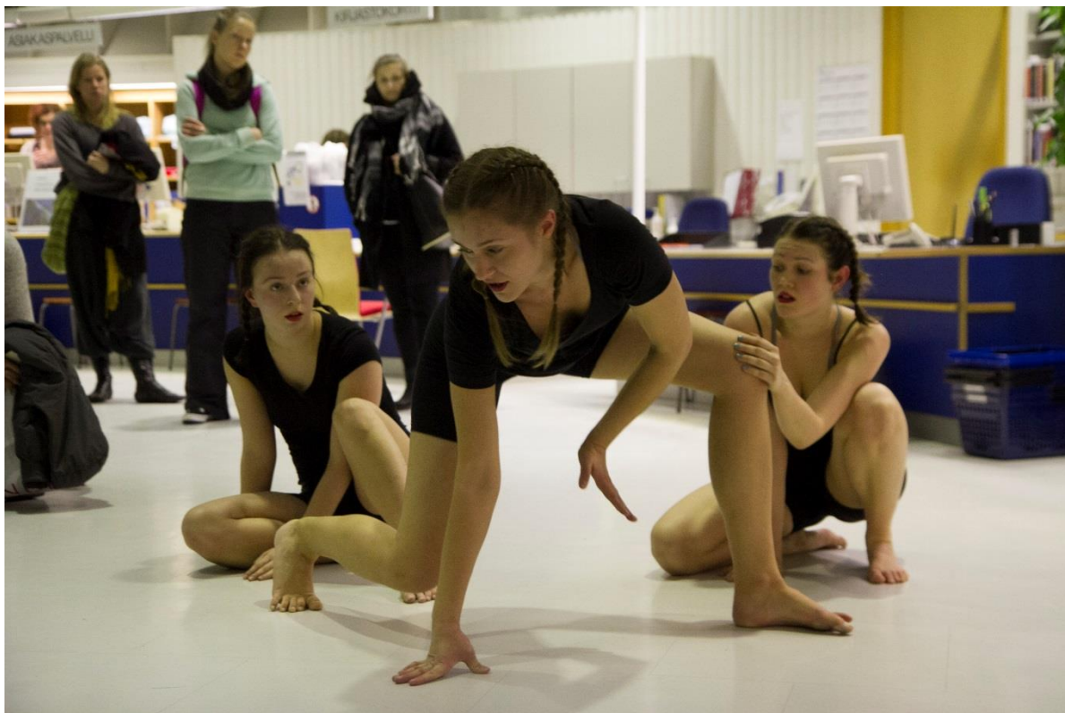
Kuva 7: Kuva teoksesta. Visa Timonen 2016.

Feikki-”kissoissa” (6.5.) alkuun pussien paneminen päähän ja hyllyvälien etualalle siirtymisessä pyritään yhdenaikaisuuteen, mutta loppu on vapaata improvisaatiota etenemisen liiketehtävän puitteissa. Olemme sopineet, että huulipunan laitto tapahtuu aulasta katsottuna etualalla, minkä jälkeen tanssijat siirtyvät taka-alalle. He kävelevät uudelleen etualalle kaksi kertaa ja kolmannella kerralla astuvat ulos hyllyjen välistä.