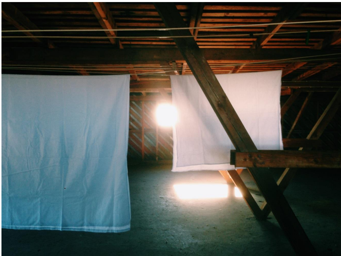
Kuva 1: Ullakon mainoskuva

Yhteisten kokemusten pohjalta tuntui luonnolliselta pyytää samoja tanssijoita jatkamaan työskentelyä kanssani uuden teoksen merkeissä. Tiesin, että haluaisin työskennellä samankaltaisilla työskentelytavoilla kuin Ullakon aikana. Päätökseen vaikutti työskentelyn mutkattomuuden ja onnistumisen kokemukset.