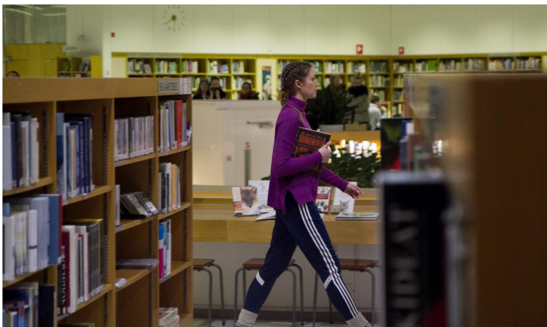
Kuva 8: Kuva teoksesta. Visa Timonen 2016.

Koen, että teoksesta tekee toimivan nimenomaan tanssijoiden välinen toisten havainnointi, avoimuus ja luottamus. Teoksen aikana monet päätökset syntyvät joko tanssijoiden yhteisenä päätöksenä tai siten, että joku ehdottaa muutosta ja toivoo tai luottaa, että muut tukevat ja seuraavat. Tämä ei onnistuisi, ilman tanssijoiden välistä avoimuutta ja luottamusta, joiden koen olevan edellytyksenä improvisaation onnistumiselle.