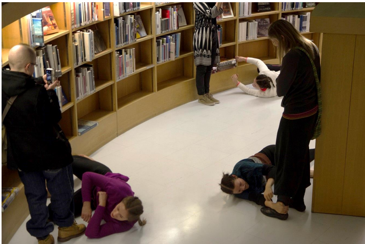
Kuva 9: Kuva teoksesta. Visa Timonen 2016.

Välillä mietin, mikä on katsojan rooli tanssiteoksessa. Miksi jokin teos tuodaan katsojien eteen ja toinen jää harjoitussaliin? Hiljaisuutta-teoksen taustalla on toive yhteisöllisyydestä ja yhteisestä kokemisesta, minkä vuoksi olen halunnut tuoda teoksen yleisön eteen. Julkisissa tiloissa ihmisten välittäminen toisistaan on usein vähäistä tai välinpitämätöntä. Toiveenani oli jollain lailla herättää ihmisiä ajattelemaan nykyistä yhteisöllisyyttämme.