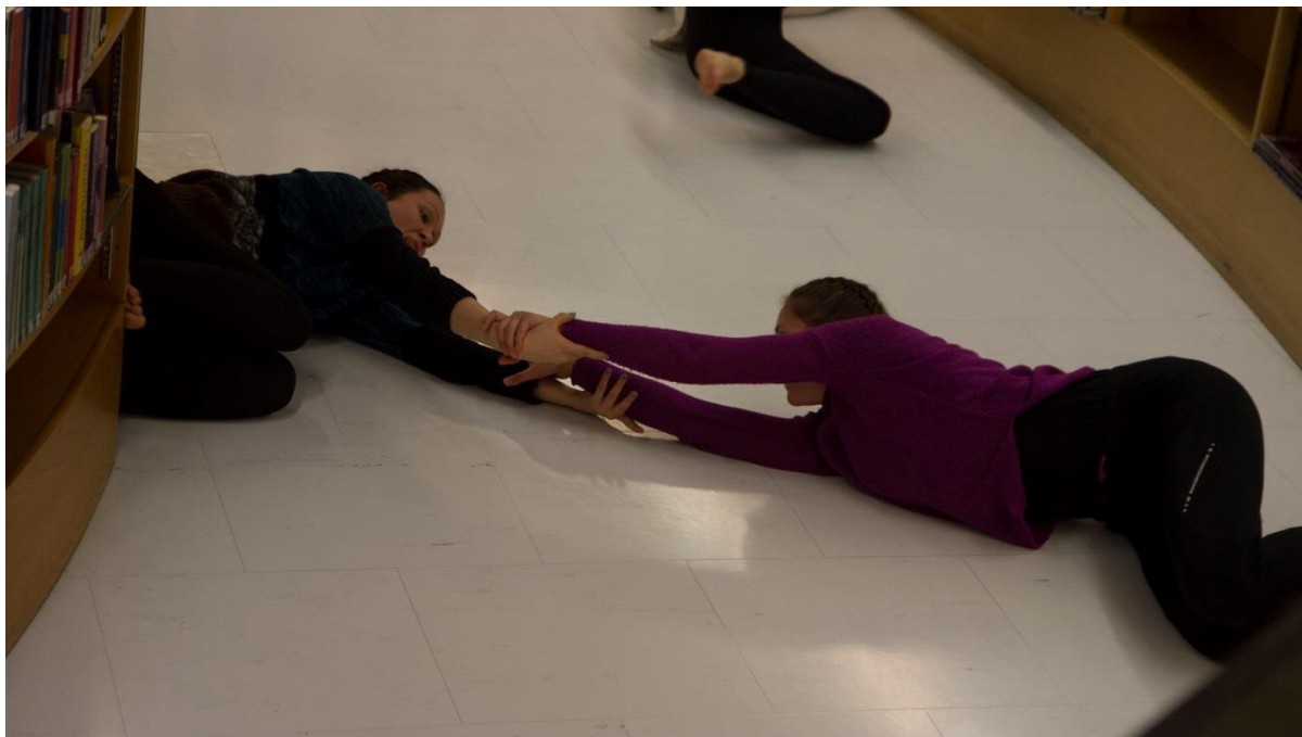
Kuva 3: Kuva teoksesta. Visa Timonen 2016.

Tanssijat päätyvät lähelle portaikkoa, riisuvat villapaitansa, ottavat hyllystä sanomalehdistä taitellut pussit mukaansa, kävelevät portaat ylös ja jatkavat matkaansa kohti aikuisten kaunokirjallisuusosastoa.