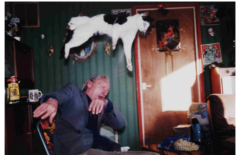
Kuva 7. Bingham Richard Untitled, 1995.