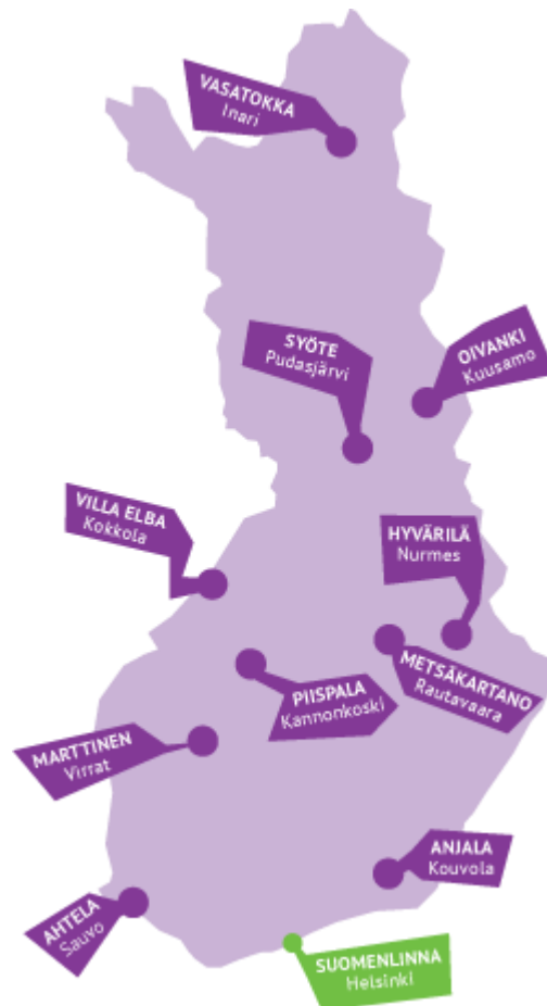
Kuvio 2. Nuorisokeskukset (Suomen nuorisokeskusyhdistys ry 2011c. Viitattu 8.6.2015).

le keskuksille yhtenäisen aseman ja oikeudet sekä tukea jokaisen keskuksen toimintaa tarjoamalla tarvittaessa asiantuntijoiden apua. (Suomen nuorisokeskusyhdistys ry 2011b.)