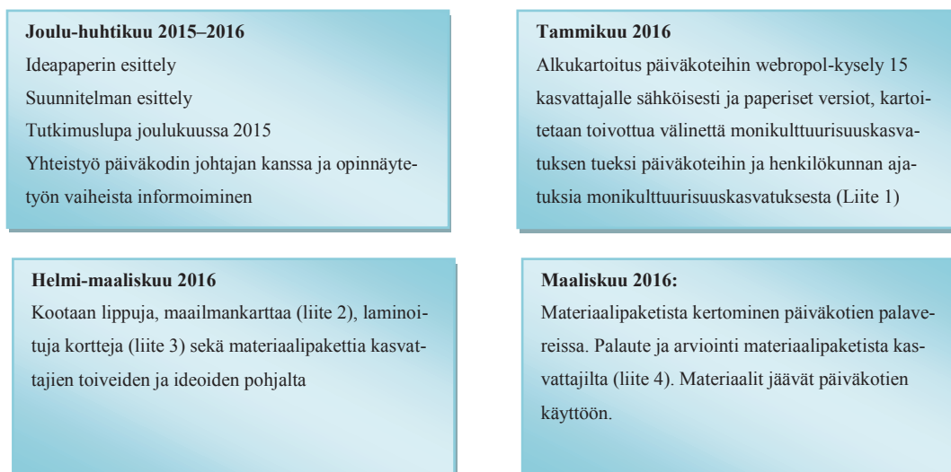
KUVIO 1. Produktin etenemisen suunnitelma