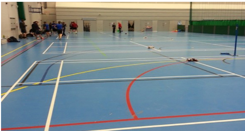
Kuva 8: Cheshiren kampuksen liikuntahalli