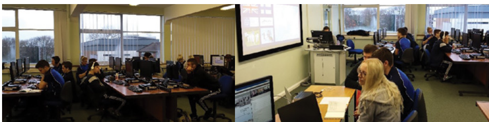
Kuva 3: eSeminaari Manchesterin päässä