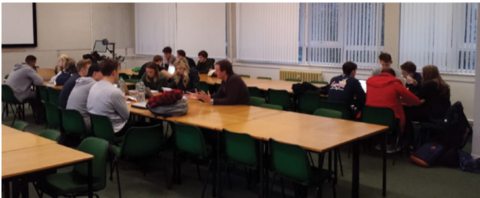
Kuva 6: MMU:n 2. vuoden opiskelijat opintojen parissa