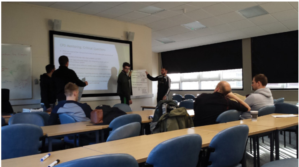
Kuva 7: Ryhmätyötunti

Liikunnan ja vapaa-ajan opiskelijat kyselivät meiltä kahden vierailumme välillä aktiivisesti mahdollisuuksista suorittaa maisterin opintoja MMU:ssa. Tämän vuoksi pyysimme päästä seuraamaan maisteriohjelmassa (Sports Coaching) olevien opiskelijoiden tunteja sekä audienssia ohjelman vastaavan kanssa.