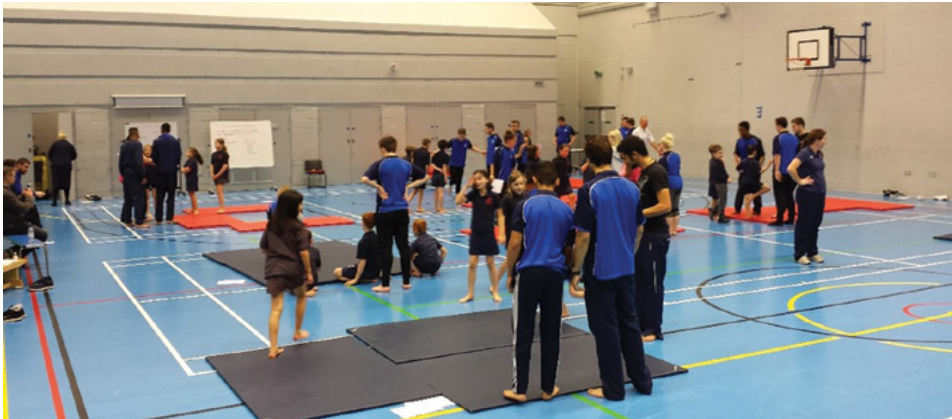
Kuva 5: MMU:n 1. vuosikurssin opiskelijoiden opetusharjoitus

Yhteinen seminaari kesti valmisteluineen n. 2 tuntia, jonka aikana opiskelijat saivat hyvän kuvan molempien maiden vallitsevasta liikunnanopetusjärjestelmästä. Opiskelijat saivat myös ensikosketuksen toisiinsa mikä helpottanee kevään case työskentelyä yhteisissä pienryhmissä. Seminaarin päätteeksi vedimme opettajien kesken yhteen seminaariin annin. Molemmat osapuolet kokivat, että seminaari oli hyvin onnistunut ja palveli tarkoitustaan erinomaisesti. Iltapäiväksi meidät kutsuttiin seuraamaan kahta opetustapahtumaa. Klo 13.00 pääsimme seuraamaan opiskelijoiden voimistelun opetusharjoitusta urheiluhalliin, johon oli kutsuttu paikallisia lapsia osallistujiksi.