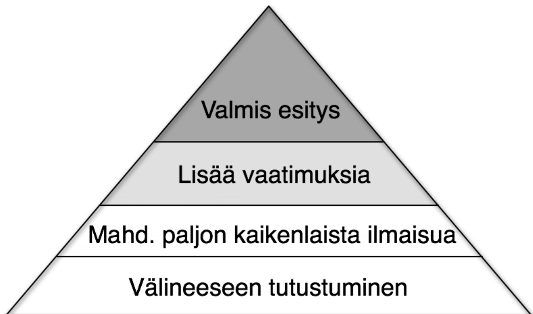
Kuva 3: Oma versioni pyramidista nukketeatterin opettamisen tueksi

Nukketeatterista puhuttaessa lisäksiin kolmioon vielä yhden kerroksen aivan alimmaisiksi, kaiken perustaksi. Ennen ilmaisuun ryhtymistä on hyvä tuntea työvälineensä ja olla sinut sen kanssa. Pitää tuntua siltä, että on mahdollista ilmaista asioita tietynlaisen välineen, nukken, kautta. Työvälineeseen tutustuminen vie draamateatteriin (jossa välineenä on yleensä oma keho) verrattuna enemmän aikaa ja kolmion alimmalla tasolla täytyy ehkä viipyä pitkäänkin, joka voi tulla yllätyksenä, jos nukketeatterista ei ole aiempaa kokemusta. Kolmion ”kaikenlaisen ilmaisun” -kerrokselle voi siirtyä vasta sitten, kun väline on tuttu ja sen kautta ilmaisu tuntuu mahdolliselta.