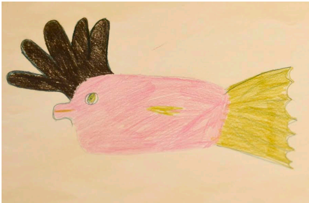
Kuva 4: Luonnos kampelanukesta työpajaesitykseen ”Lumikki ja Kampela”