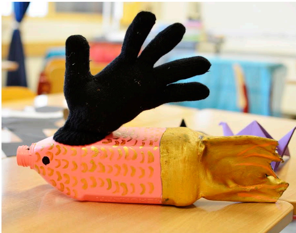
Kuva 5: Valmis kampelanukke työpajaesityksestä ”Lumikki ja Kampela”

Kuvissa näkyy erään työpajaryhmän suunnittelu- ja luomistyön vaiheet. Kampelaa tehneet nuoret saivat idean nukken ulkonäköön heti käytettävissä olevat materiaalit nähtyään. Kampelanukke toteutti esityksessä Lumikin toiveita ja ”joras” lopuksi musiikin tahdissa. Mukana olleiden valmiiden teatterinukkeiden innoittamina nuoret olivat tyytyväisiä mehukanisteri-Kampelaansa siksikin, että kanisterin kahva toimi hienosti nuketuskahvana.