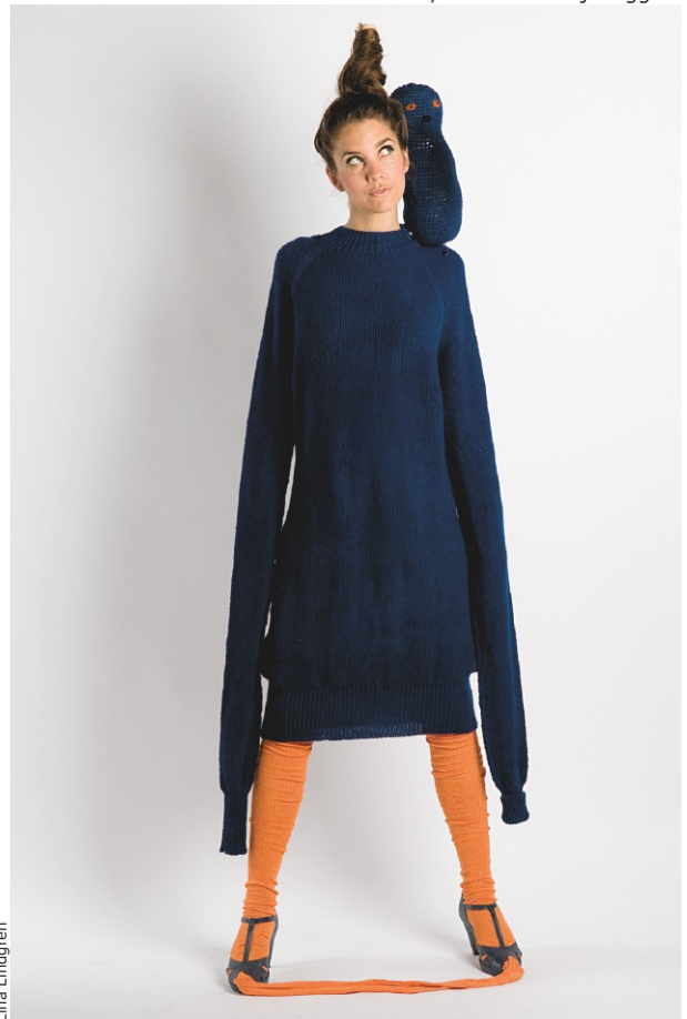
Trolli, Morran och Fjällugglan