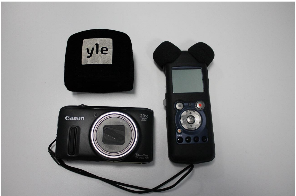
Kuva 1. Kuvassa näkyy nauhoituslaite Olympus LS-5 jonka vieressä vasemmalla tuulisuoja Yle logolla. Suojan alla on Canonin PoweShot SX240 HS digitaalikamera.

Ei kannata näyttää olevansa ammattitaidoton. Älä sekoile tekniikan kanssa tai tiputtele nauhuria. (Koskinen 2015.)